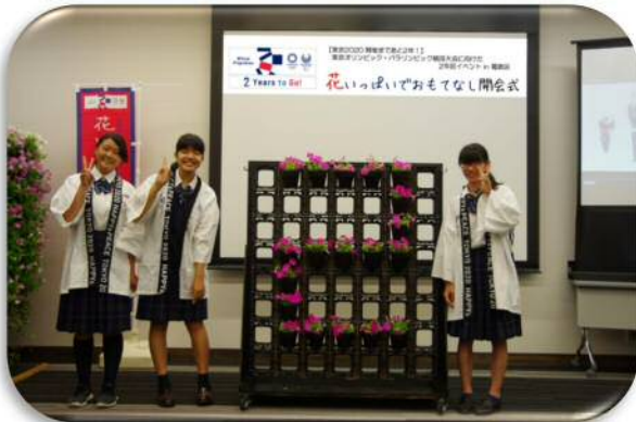
農産高校生徒さんによる ライブパフォーマンス