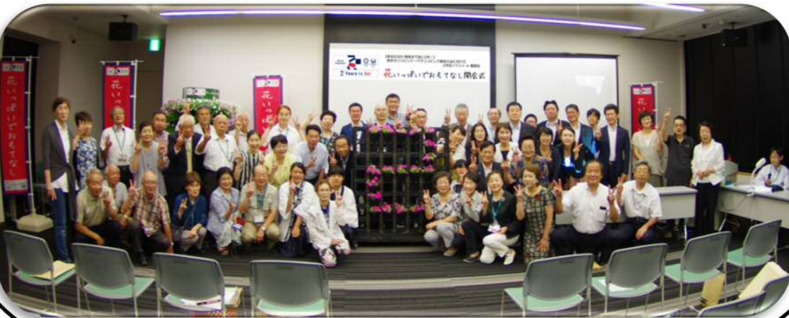
参加者全員で東京 2020 大会の 2 年前を表す「2」をつくりました。