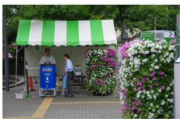
会場の入り口は、フラワー メリーゴーランドでお出迎え

6月10日にテクノプラザかつしかで開催されたかつしか環境・緑化フェア2018の鉢上げ体験コーナーに協議会から10団体13名の方が参加しました。