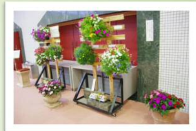
農産高校定時制生徒さん のハンギングで会場を装飾