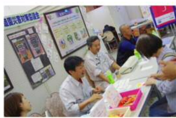
農産高校全日制生徒さんの押し花 で、はがき作り