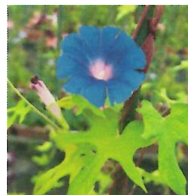
G1018 黄立田葉瑠璃切咲 (きたつたばるりきれざき)