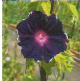
G582 黄乱菊葉紺爪覆輪多曜咲 (きらんぎくばこんつめふくりんたようざき)