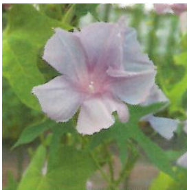
G507 青立田葉淡藤色切咲 (あおたつたばあわふじいろきれざき)