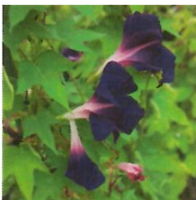
G568 青抱並葉紫石畳夫婦咲 (あおじかかえなみばむらさきいしだたみめおとざき)