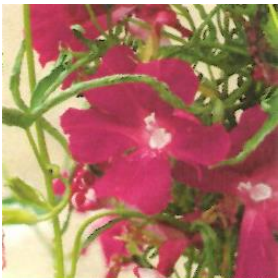
G509 青縮緬立田蜻蛉雨龍葉鮮紅色車咲 (あおちりめんたつたとんぼあまりょうばせんこうしよくくるまざき)

縮緬と立田の変異を合わせもつため、葉は細く5裂に切れ込みます。花は花卉が切れ風車に似た車咲になります。