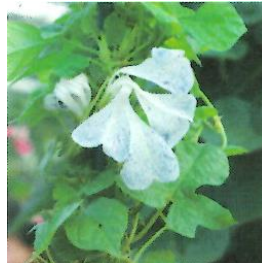
G892 黄蝉葉藤色吹掛絞石畳咲 (きせみばふじいろふっかけしほりいしだたみざき)

縮緬と立田の変異を合わせもつため、葉は細く5裂に切れ込みます。花は花卉が切れ風車に似た車咲になります。