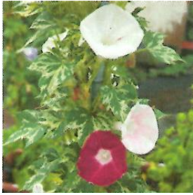
G265 青斑入並葉姫紅時雨絞咲分丸咲 (あおふいりなみばひめべにしぐれしほりさきわけまるざき)