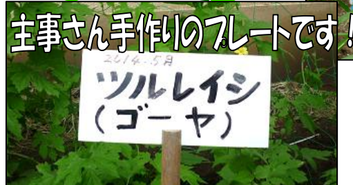
主事さん手作りのプレートです！