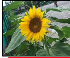
7月・・・プール脇には、ひまわりが先日の強風にもめげずにまっすぐ伸びています。大輪のひまわりの花がまぶしいほどきれいに咲き誇っていました。