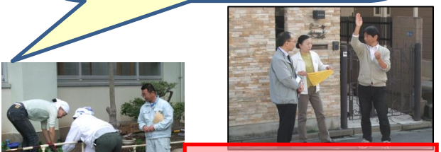
学校の先生方とは常に連携を取り、今後の活動を話合っています。