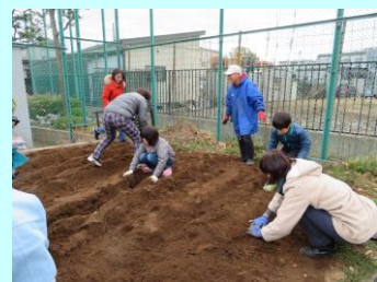
ジャガイモの植え付け